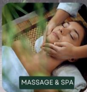
MASSAGE & SPA